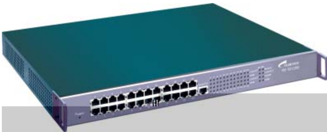
图 2-1 S2126S 产品外观图

产品尺寸 : ( W × H × L ) 440mm × 44mm × 240mm